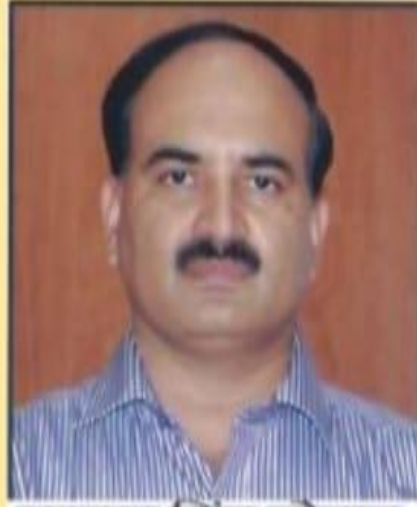
सरदार सिंह चोहान उपायुक्त